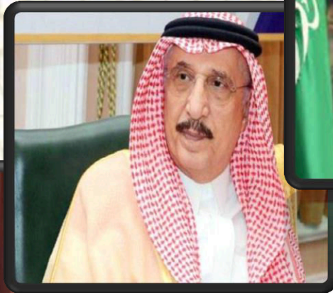
صاحب السمو الملكي الأمير محمد بن نافع بن عبدالعزيز آل سعود حفظه الله أمير منطقة جازان