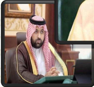
صاحب السمو الملكي الأمير محمد بن عبدالعزيز بن محمد بن عبدالعزيز آل سعود حفظه الله نائب أمير منطقة جازان