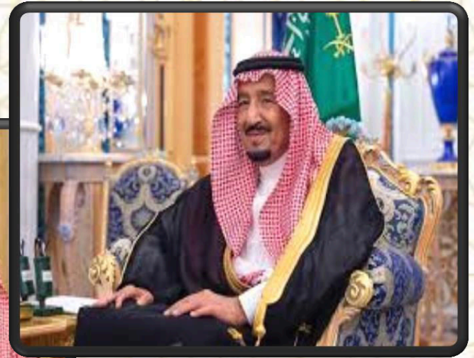
خادم الحرمين الشريفين الملك سلمان بن عبدالعزيز آل سعود حفظه الله