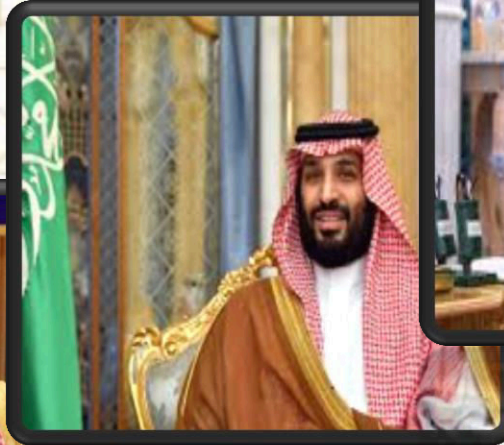
صاحب السمو الملكي الأمير محمد بن سلمان بن عبدالعزيز آل سعود حفظه الله ولي العهد نائب رئيس مجلس الوزراء وزير الدفاع